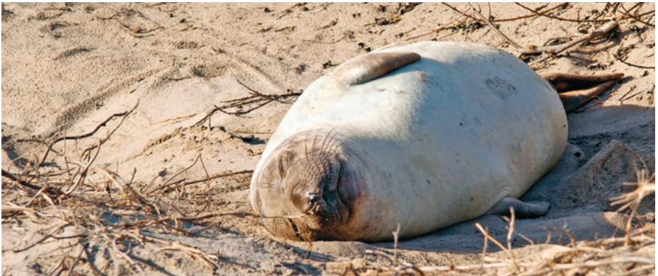
Kigge - ikke røre! Sæler kan dø af influenza, som kan smitte mennesker.

www.odsherred.dk søg på "påkørte dyr", "døde dyr på stranden" eller "tilskadekommet vildt"