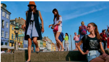
Turister må gerne overnatte i København og på Frederiksberg alligevel