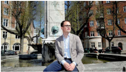
Borgmesteren har ordet: Det har jeg lært af coronakrisen