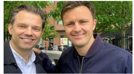
Frederiksberg Kommune og FCK i nyt samarbejde om skoleelever