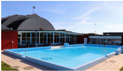
Nu kan KB's medlemmer igen hoppe i baljen